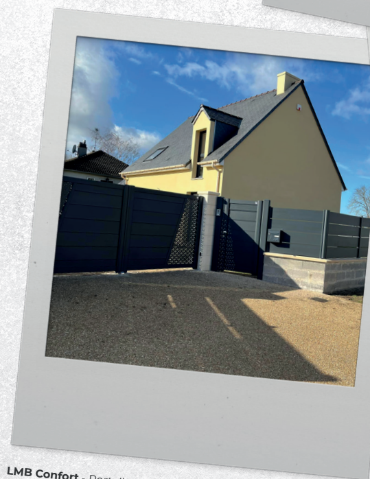
LMB Confort - Portail avec décor Bulles de savon et clôture Tramontane 250 - Yvelines