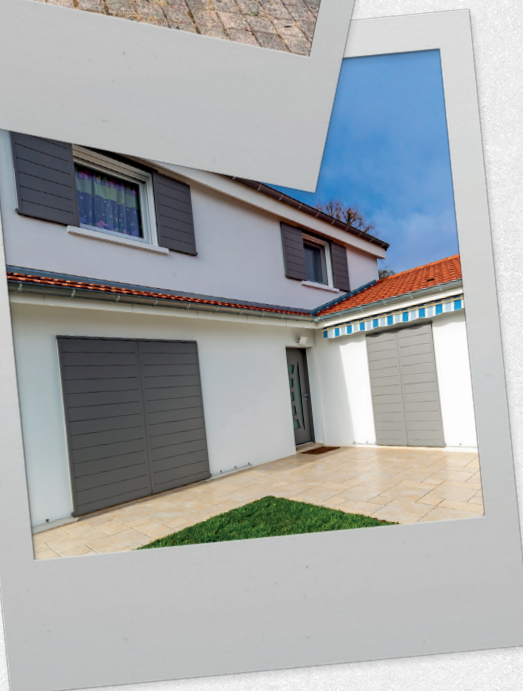
pidoux - Volets coulissants Exclusif Rhône