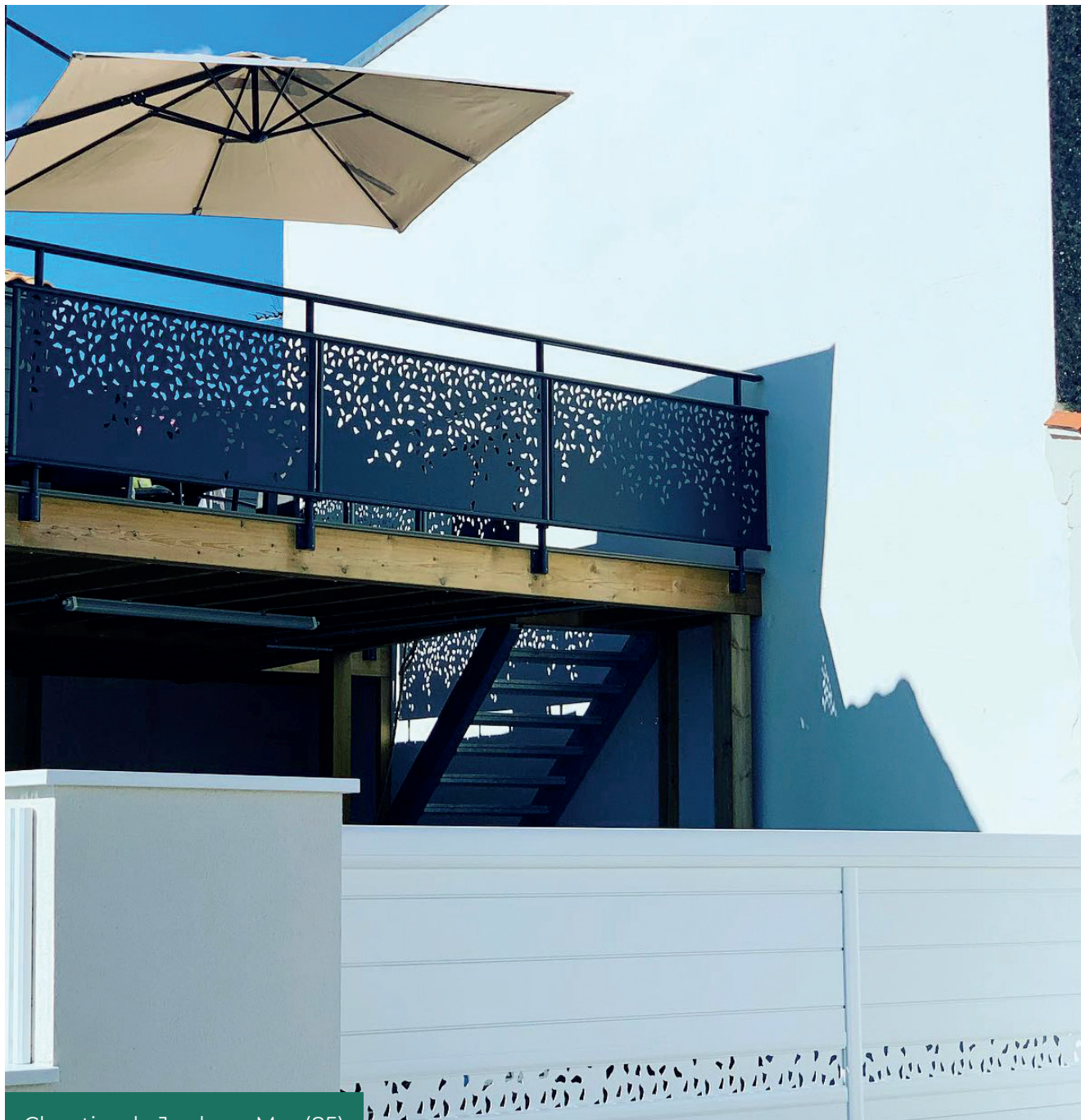
Chantier de Jard-sur-Mer (85)