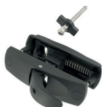
Arrêt Stopbox Tirette arrêt Stopbox (arrêt stopbox sur traverse intermédiaire)