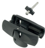
Arrêt Stopbox Tirette arrêt Stopbox (arrêt stopbox sur traverse intermédiaire)