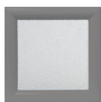
Carré ou losange 220 x 220 300 x 300