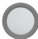
Rond ø 235 ø 315