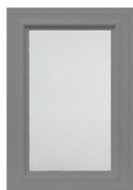
Rectangle int. 380 x 220 ext. 505 x 345