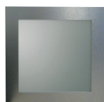
Carré ou losange int. 220 x 220 ext. 300 x 300