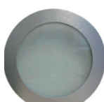
Rond ø 235 ø 315