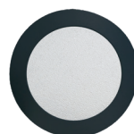
Rond ø 235 ø 315