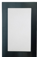
Rectangle int. 405 x 215 ext. 511 x 321