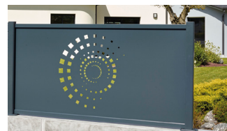
Panneau spirale centrale