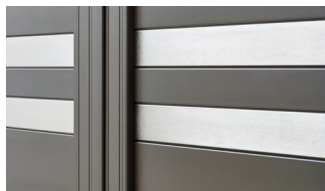
Estacade (uniquement disponible sur Origin 255)